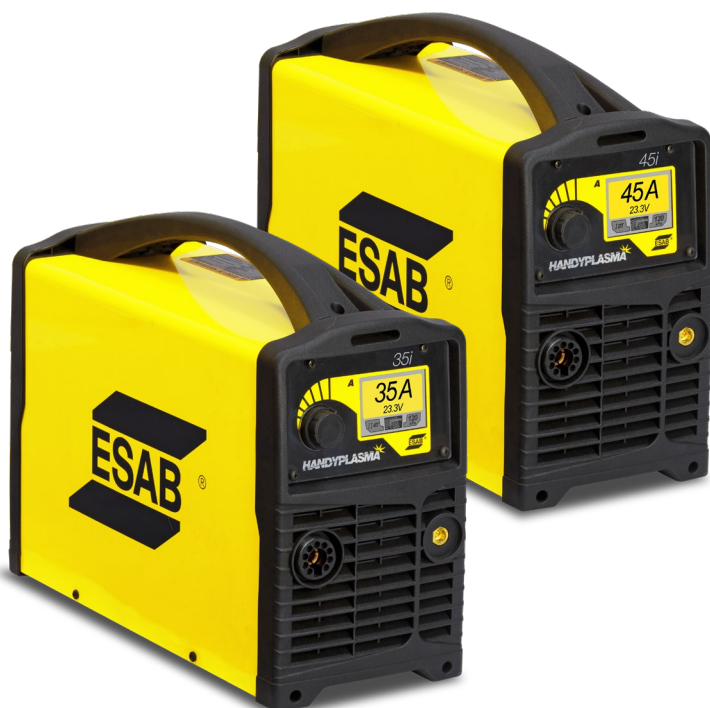
Аппарат HandyPlasma 35i / 45i

Портативная и удобная в работе система плазменной резки с напряжением питания 220В, 1ф, 50/60Гц.