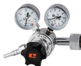
УР-6-6 КР крупногабаритный

Редукторы УР предназначены для понижения и регулирования давления газа, поступающего из баллона, и автоматического поддержания постоянно-го рабочего давления. Углекислотные редукторы позволяют работать с большими объемами, обеспечивая при этом точность настройки при длительной работе. Углекислый газ часто используется при механизированной сварке MIG/MAG и в других областях. В редукторах установлен предохранительный клапан, соединенный с рабочей камерой, который обеспечивает дополнительную безопасность при работе с газом.