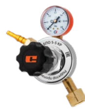
БПО-5-5 KP крупногабаритный

Редукторы БПО предназначены для понижения и регулирования давления газа, поступающего из баллона, и автоматического поддержания постоянного рабочего давления. Пропановые редукторы изготавливаются с одним манометром, показывающим рабочее давление газа.