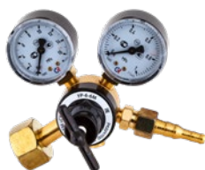
УР-6-6 М малогабаритный