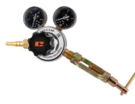
BAO-5-5 KP крупногабаритный

Редукторы БАО предназначены для понижения и регулирования давления газа, поступающего из баллона, и автоматического поддержания постоянного рабочего давления газа. Ацетилен является легковоспламеняющимся газом, и в целях безопасности ацетиленовые редукторы крепятся к газовым баллонам накладными хомутами специальной конструкции.