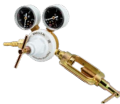
BAO-5-5 AL крупногабаритный