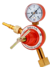
БПО-5-5 AL крупногабаритный