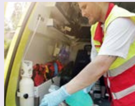
ОБОРУДОВАНИЕ ДЛЯ ГОСПИТАЛЬНЫХ ПАЛАТ